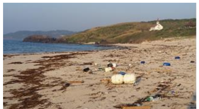
▲ゴミが漂着している砂浜

海水浴場を綺麗に保つには、ゴミを出さないように意識することが重要です。そして「来た時よりも美しく」という言葉があるように、砂浜に遊びに行った際に、一人一人がゴミを一つでも拾って帰れば、より一層美しい砂浜を創り上げることができるのではないでしょうか。海水浴シーズンを迎えるにあたり、皆が気持ちよく過ごせるよう意識を向けるきっかけになればと思います。