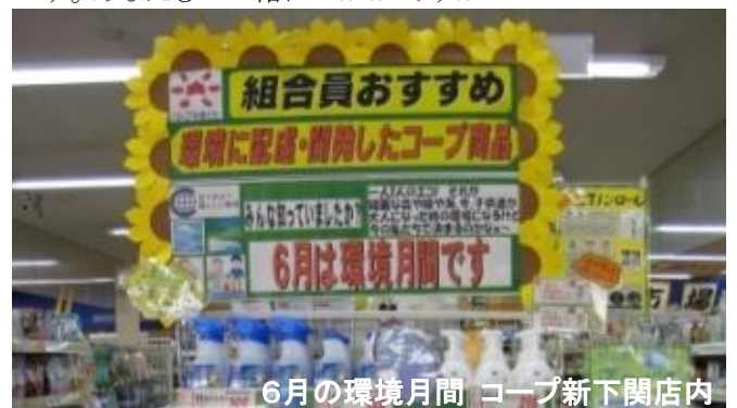
6月の環境月間 コープ新下関店内

さあ、11月の環境月間には一日エコチェック大作戦&電気ダイエットコンクールに家族一丸となって取り組みま〜す。あなたも一緒にいかがですか？