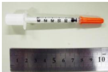
実際に排出された物

注射針などを捨てる際は必ず医療機関・販売店へ相談し、絶対に指定ごみ袋に入れて排出しないでください。