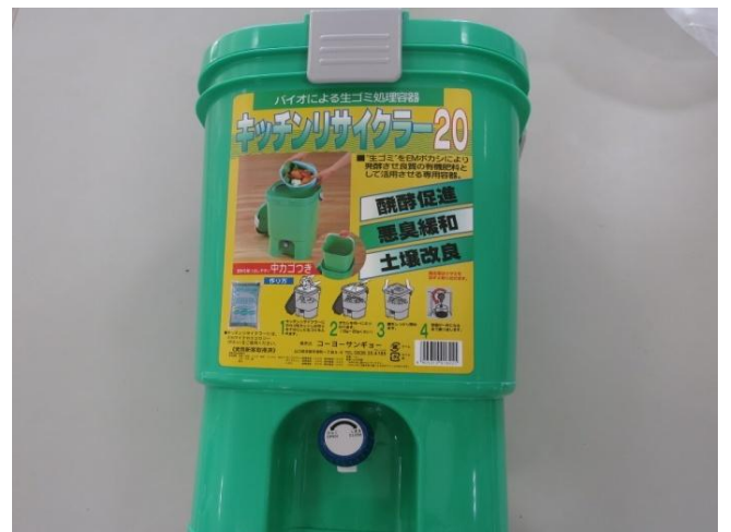
▲ EMによる家庭用生ゴミ処理器 キッチンリサイクラー